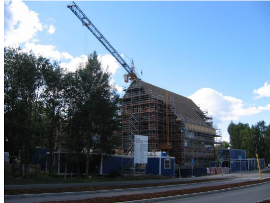
Kirkonkymppiä rakennettiin syksyllä 2004

Virastotalon ulkoasussa on toistettu Espoon tuomiokirkon muotoja. Talossa on kaksi rakennusta kulmittain kiinni toisissaan ja sen on suunnitellut Arkkitehtitoimisto Lahdelma-Mahlamäki.