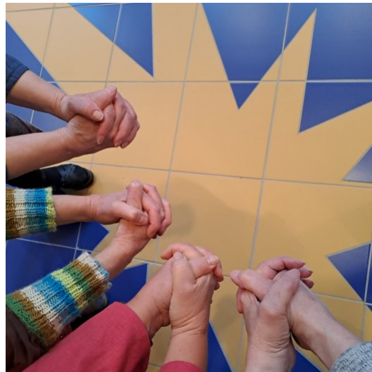
Kuva: Kirkkonummen suomalainen seurakunta